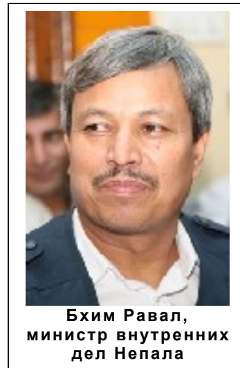
Бхим Равал, министр внутренних дел Непала

16 декабря в окрестностях Гаиндакота в округе Навалпараси полиция разогнала 200 поселенцев, захвативших ранее при поддержке маоистов 3,7 га земли, принадлежащей крупному деятелю « Непальского конгресса » Сурье Бхакте Адхикари. Когда посе-