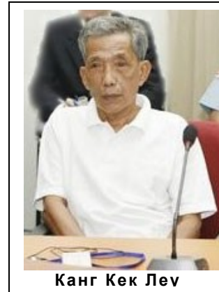
Канг Кек Лев

Поскольку буржуазные журналисты любят называть полпотовцев «ортодоксальными приверженцами маоизма» , стоит ещё раз напомнить, что маоистская фракция в руководстве Компартии Кампучии была ими репрессирована.